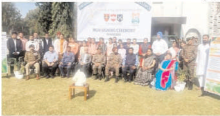
JAMMU EXPRESS NEWS AKHNOOR, NOV 3

The 'Swarnim Centre of Excellence & Wellness' project, in collaboration with Armoured Vehicles Nigam Limited (AVNL), a Ministry of Defence (MoD) Public Sector Undertaking (PSU), has been conceived to create a brighter future for the youth of Akhnoor and the surrounding regions. This initiative is primarily focused on economically disadvantaged sections of society, especially those hailing from rural, semi-rural, and non-urban areas.